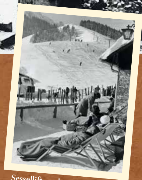
Sessellift an der Steinberg-Alm anno 1960